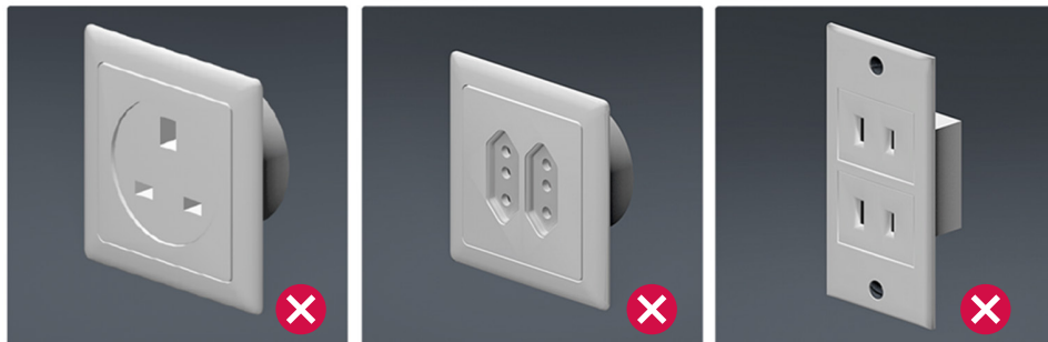
Ejemplos de bases de toma de corriente de otros países como Reino Unido, Italia y Estados Unidos.

Cada país dispone de un sistema propio para las bases de toma de corriente y las clavijas definido en función de las características técnicas de sus instalaciones eléctricas.